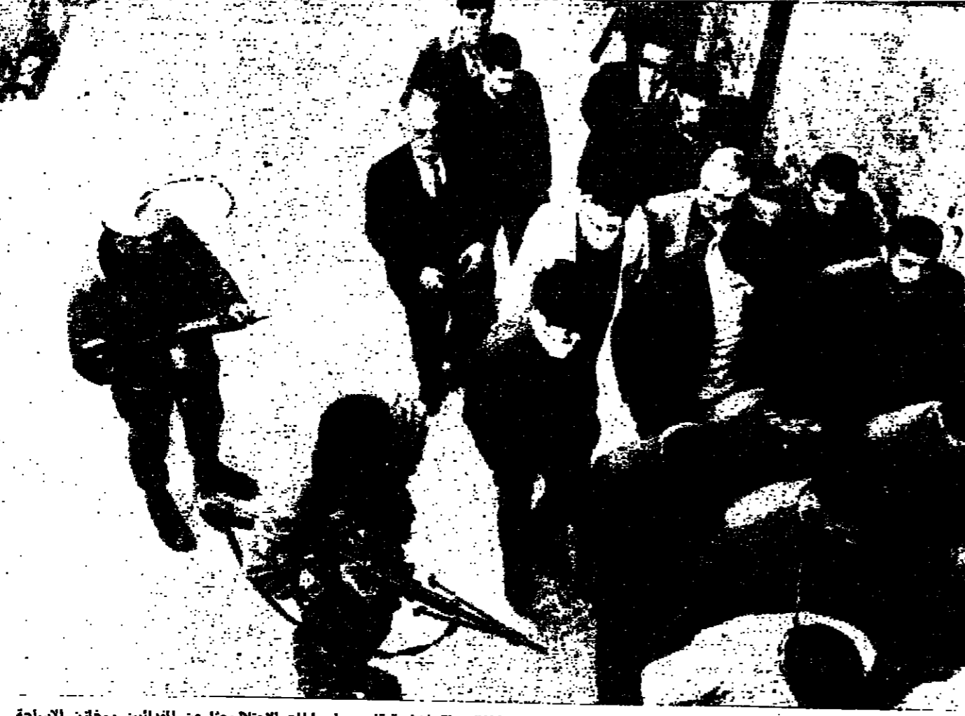
جنود اسرائيليين يصورون وشاشته هبوطا عدد من ابناء نيلس اعترافا لاجلهم فنتامية قامت بها سلطات الاحتلال بخفا عن المدنيين ومخازن الاسلحة.

اكر - رويتر - احتضت غانا امس بالكرى الثانية للاطاحة بالرئيس كوامي نكروما بعرض عسكري ووصولوا خاصة من المظاهرات التي تحاصر القاعدة فزت في سلة امس بما يزيد على ١٢٠٠٠ قذيفة في عملية قصف متواصلة استمرت خمس ساعات. وفي الوقت ذاته هاجمت قوات شيوعية كتبية من القوات الفيتنامية الجنوبية فربط في القضاء الهامي من القاعدة في سيليفون. وفي سيليفون ١٦ شخصا على الأقل عندما قريت قاعدة تان سلانجوت الجوية بالسواتر في ساعة مبكرة من صباح امس. وقال ناطق عسكري ان ١٢ قذيفةا جميعهم بمقتضى الذين منهم من الجنود قترا وجرح ستة آخرون.